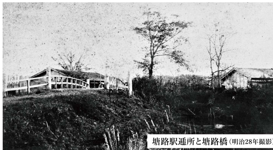
塘路駅通所と塘路橋(明治28年撮影)