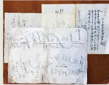
越善家より寄贈された古文書や地図

大きなアイヌコタン(アイヌ語で集落の意味)により栄えた塘路特有の歴史の一つと言えるでしょう。